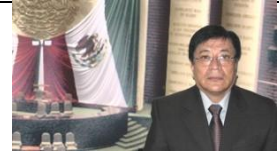
Dip. Israel Beltrán Montes Secretario PRI