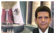
Dip. Pascual Bellizzia Rosique Integrante PVEM